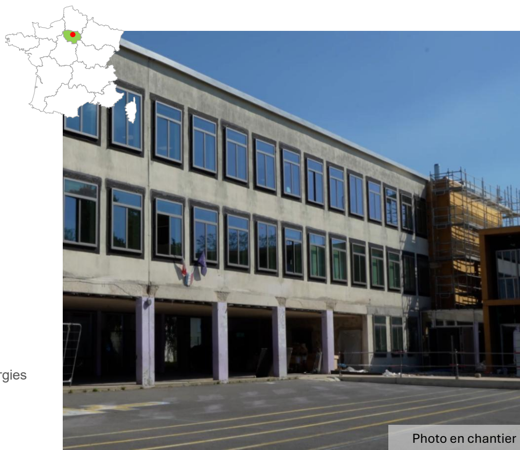
Photo en chantier

#cours oasis #amélioration thermique #BBC Effinergie